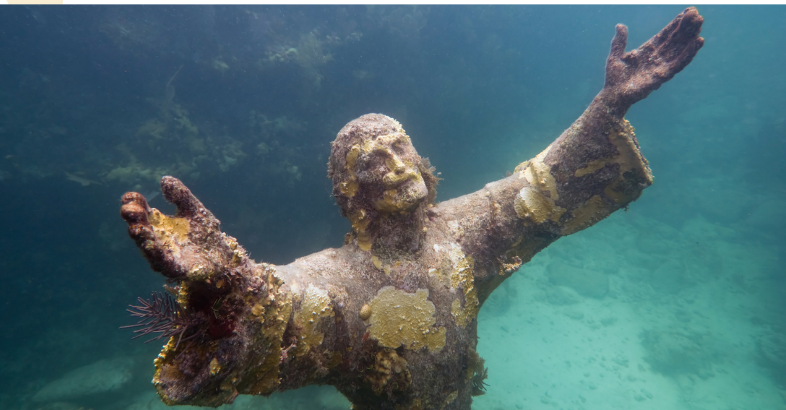
El Cristo del abismo, 1954. Guido Galletti. Bronce (2,5 m).

EDUCACIÓN SECUNDARIA - BACHILLERATO - FP