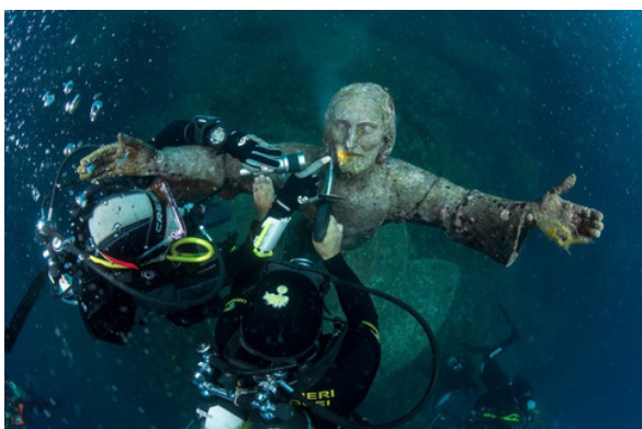
Restauración del Cristo del abismo .

Hoy en día, la inmersión para observar El Cristo del abismo es una de las excursiones más conocidas y apreciadas del litoral italiano, ya que la escultura se ha convertido con el paso del tiempo en un símbolo de la pasión por el submarinismo y por el mar.