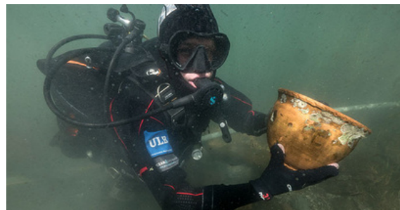
Protección del patrimonio arqueológico subacuático.

Como ciudadanos tenemos un papel crucial en la protección del patrimonio arqueológico subacuático al educarnos, denunciar actividades ilegales, apoyar iniciativas de conservación, participar en acciones de limpieza y promover un turismo responsable.