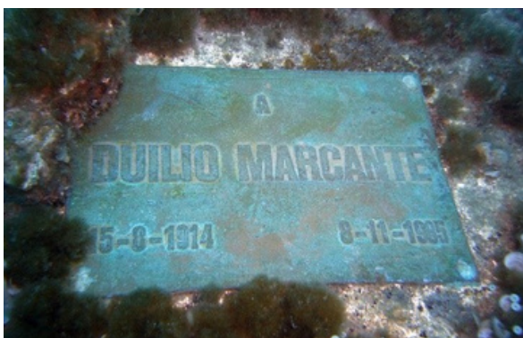
Placa de conmemoración. Imagen de libre acceso.

En 2003 la escultura fue restaurada para preservarla de la corrosión, eliminar así, las incrustaciones y colocar una de las manos del Cristo, que se separó del brazo a causa del impacto con el ancla de una nave y fue rescatada por el buceador Enea Marrone. Tras su restauración, la escultura se volvió a colocar en su ubicación original en 2004, sustituyendo el basamento anterior con uno nuevo y ubicándola a una profundidad ligeramente inferior que antes.