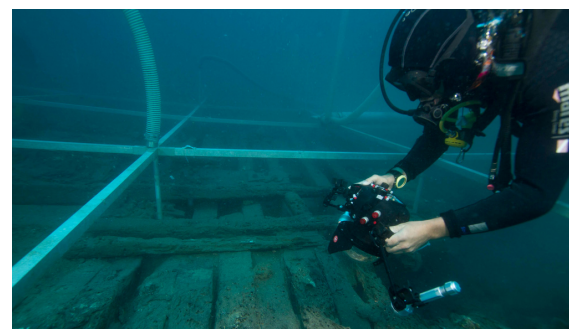
Difusión y protección del patrimonio arqueológico subacuático a través de recursos digitales.