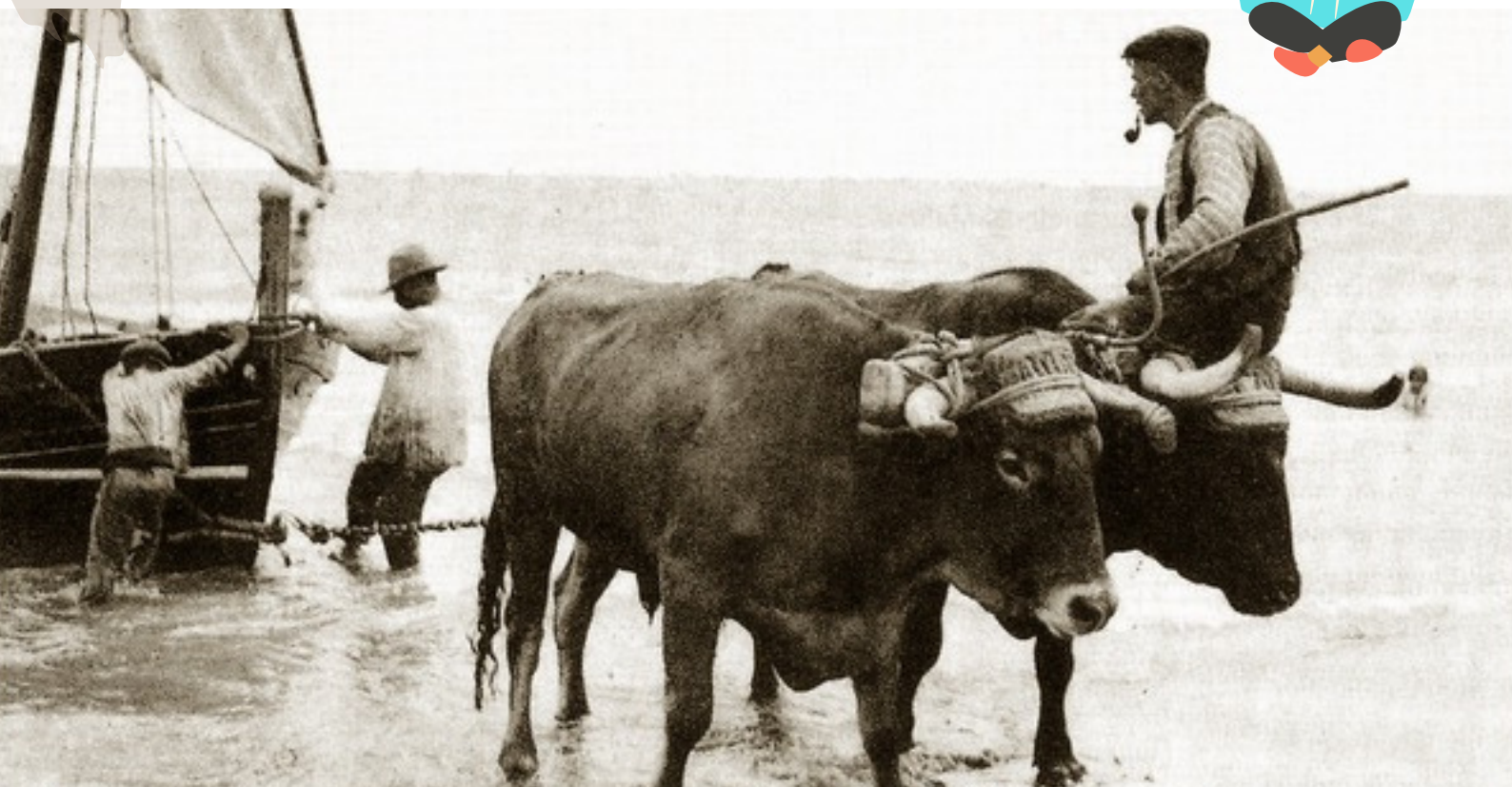
Antiga postal València, nº 99. Tranvia. Grao, regreso de la pesca del bou.