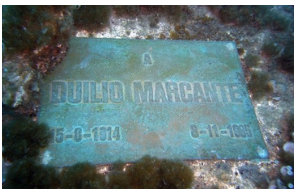
Placa de conmemoración. Imagen de libre acceso.

Hoy en día, mucha gente va de excursión para ver esta estatua especial. Se pueden hacer buceo, kayak o simplemente ver una copia de la estatua en una iglesia cerca de la bahía. También hay copias de la estatua en otros lugares del mundo, ¡cada una con su propia historia emocionante! Una está en Estados Unidos, otra en Italia y la última en una isla llamada Granada, en las Antillas Menores. Cada una cuenta una historia diferente sobre el valor y la solidaridad de las personas.