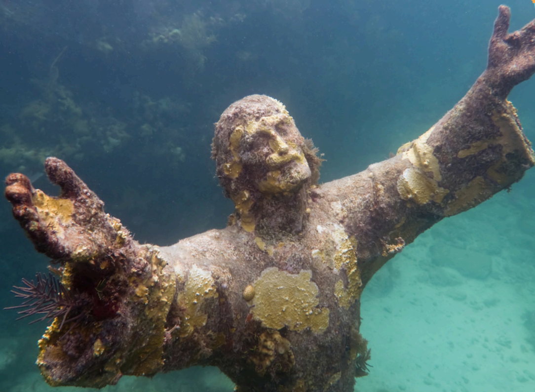
El Cristo del abismo, 1954. Guido Galletti. Bronce (2,5 m).

En las profundidades del Mar de Liguria, en el fondo de la bahía de San Fruttuoso, que está entre dos lugares llamados Camogli y Portofino en Italia , hay una estatua llamada El Cristo del Abismo .