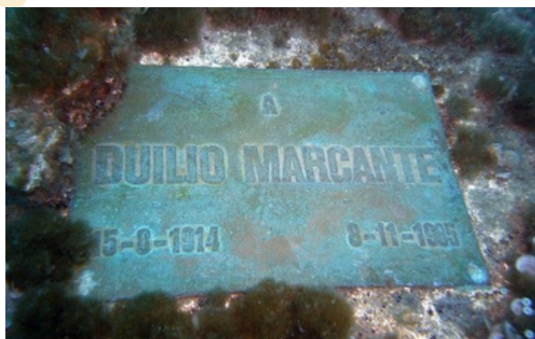
Placa de conmemoración. Imagen de libre acceso.

La idea de poner esta estatua en el fondo del mar fue de Duilio Marcante, quien era amigo de Dario Gonzatti y un experto en buceo. Con la ayuda de buceadores de la Marina Militar Italiana, la estatua fue colocada en el mar en 1954 a unos 18 metros bajo el agua. Después, en 1985, le pusieron un pedestal de piedra, y más tarde, en 2003, la estatua fue restaurada para mantenerla bonita y segura. ¡Incluso una mano que se había separado fue encontrada y puesta de nuevo!