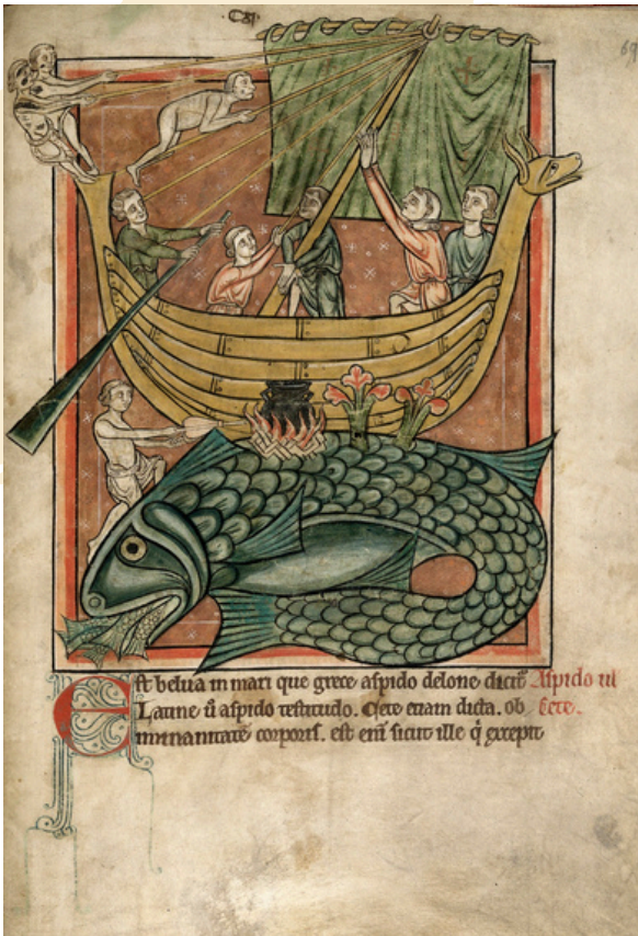
Marineros sobre el lomo de una ballena. Bestiario s. XIII

Esta leyenda apareció muchos mapas y bestiarios que alertaban sobre este monstruo marino. Los bestiarios son libros antiguos donde encontramos dibujos y relatos de animales fantásticos, pues en la Antigüedad las ballenas eran confundidas por bestias que acechaban a los marineros.