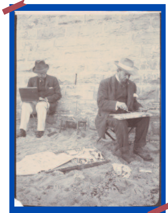
Joaquín Sorolla trabajando en la playa de Biarritz junto a otro pintor, 1906.