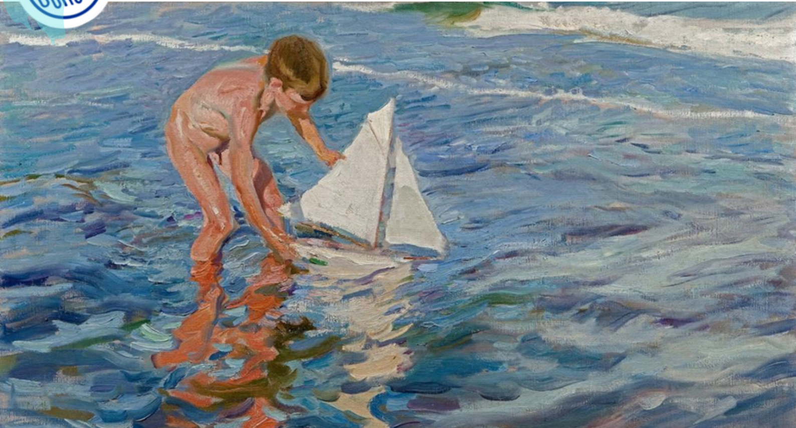
El Balandrito , 1909. Joaquín Sorolla. Óleo sobre lienzo (100 x 110 cm).

Joaquín Sorolla , artista postimpresionista valenciano nacido en 1863, dejó una huella indeleble en la historia del arte español, especialmente a través de sus obras de temática marina. Joaquín Sorolla, cuya popularidad se extendió por Europa y Estados Unidos, es una de las figuras capitales y con mayor proyección internacional de la pintura española de finales del siglo XIX y principios del XX. La luz, con su particular juego de brillos y sombras, es un elemento común en la extensa y admirada obra del pintor valenciano, junto a su tema predilecto: las escenas de playa. "El Balandrito" fue pintado en 1909 en la playa valenciana del Cabañal, y destaca como una de las obras más célebres y queridas de Joaquín Sorolla.