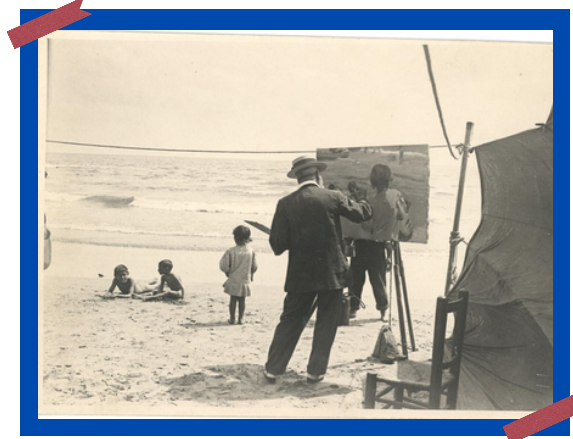
Fotografía de Sorolla mientras pintaba en la playa del Cabañal, 1909. ©Museo Sorolla.

Para Sorolla, las escenas marítimas no eran solo una expresión artística, sino también un refugio. Durante sus veranos a orillas del Mediterráneo, encontró deleite y reposo al representar asuntos de trabajo y ocio en el mar. Nadie ha captado la esencia y el brillo del Mediterráneo como él, y su éxito internacional confirma su posición como una figura central en la pintura española de finales del siglo XIX y principios del XX.