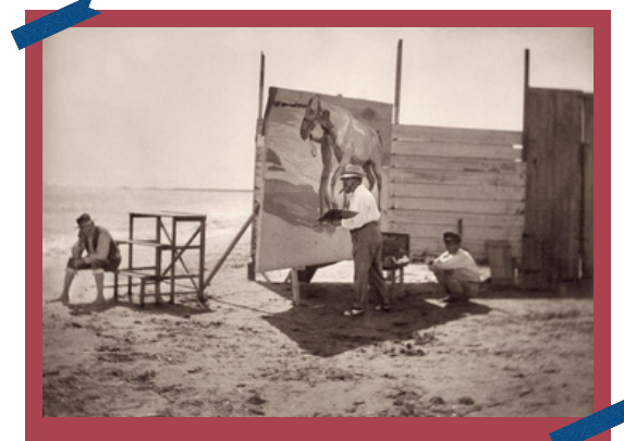
Trabajando en "El baño del caballo" en la playa del Cabañal, 1909.