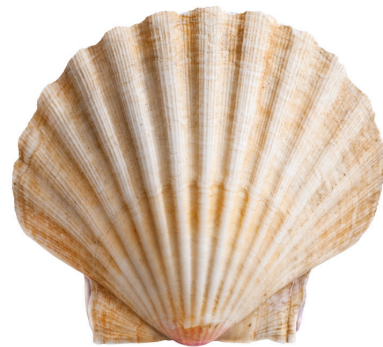
Almeja Venus Verrucosa.