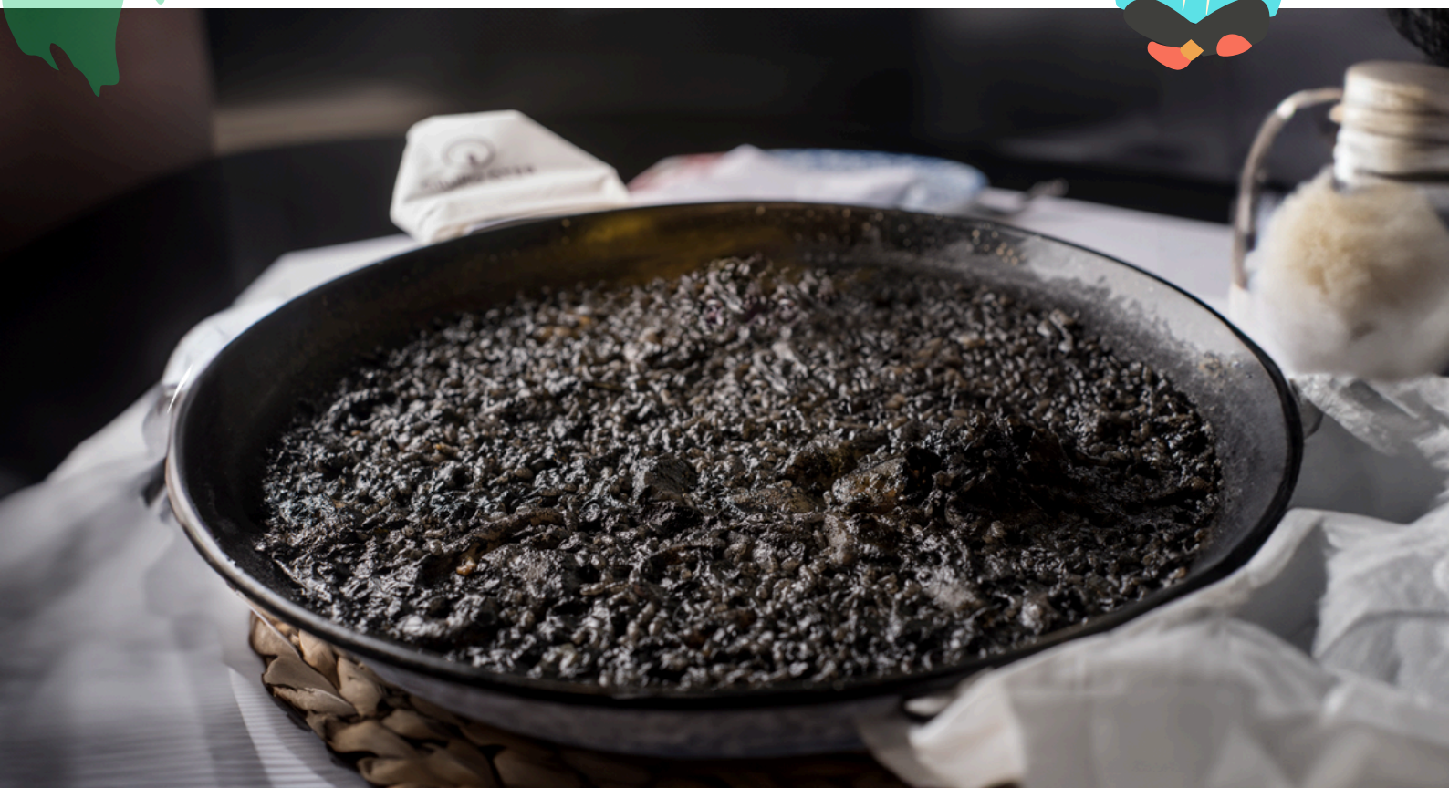
Arroz negro. Plato tradicional valenciano.

El arroz negro es un plato muy especial que se come en la Comunidad Valenciana. Lo que lo hace diferente es su color negro y su delicioso sabor a mar. Este arroz es muy conocido, especialmente en la zona de la Marina Alta, donde se prepara uno de los mejores.