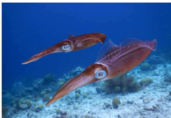
Calamares en el mar.

Y, si un calamar se siente en peligro, puede soltar una nube de tinta para escapar de sus enemigos. Esta nube no solo lo esconde, sino que también tiene sustancias que pueden desorientar el olfato de sus atacantes. ¡Así que esa tinta no es solo para el arroz, sino también para proteger a los calamares!