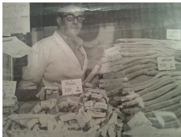
Vendedor de salazones.

El uso del bacalao en la gastronomía valenciana a pesar de no ser un pescado autóctono de nuestro litoral, se remonta al final de la Edad Media cuando los vascos lo pescaban en Terranova y llegaba hasta nuestras tierras conservado en salazón. Fue un pescado muy apreciado por su gran valor nutricional, muy rico en proteína, buen precio, facilidad de conservación en sal por no tener mucha grasa y por ser un alimento básico, especialmente durante la Cuaresma y Semana Santa.