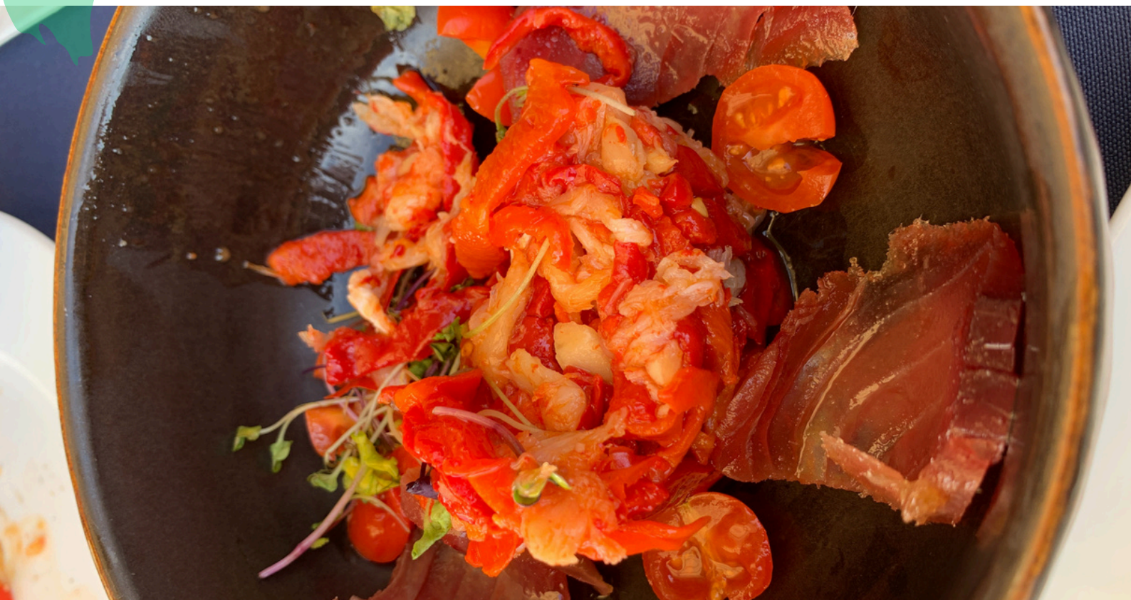
Esgarraet. Plato tradicional valenciano.

EDUCACIÓN SECUNDARIA - BACHILLERATO - FP