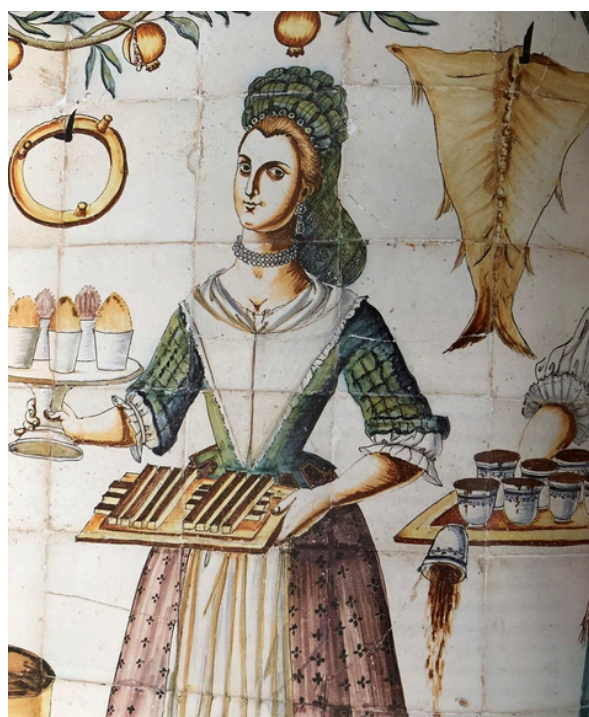
Mosaicos en el Palau de Maricel (Sitges).

Desgraciadamente los últimos estudios alertan de que por culpa de la sobrepesca y el cambio climático se están amenazando gravemente las poblaciones de bacalao del Mar del Norte y si continua el calentamiento de este mar, la supervivencia de las larvas de esta especie se va a reducir considerablemente.