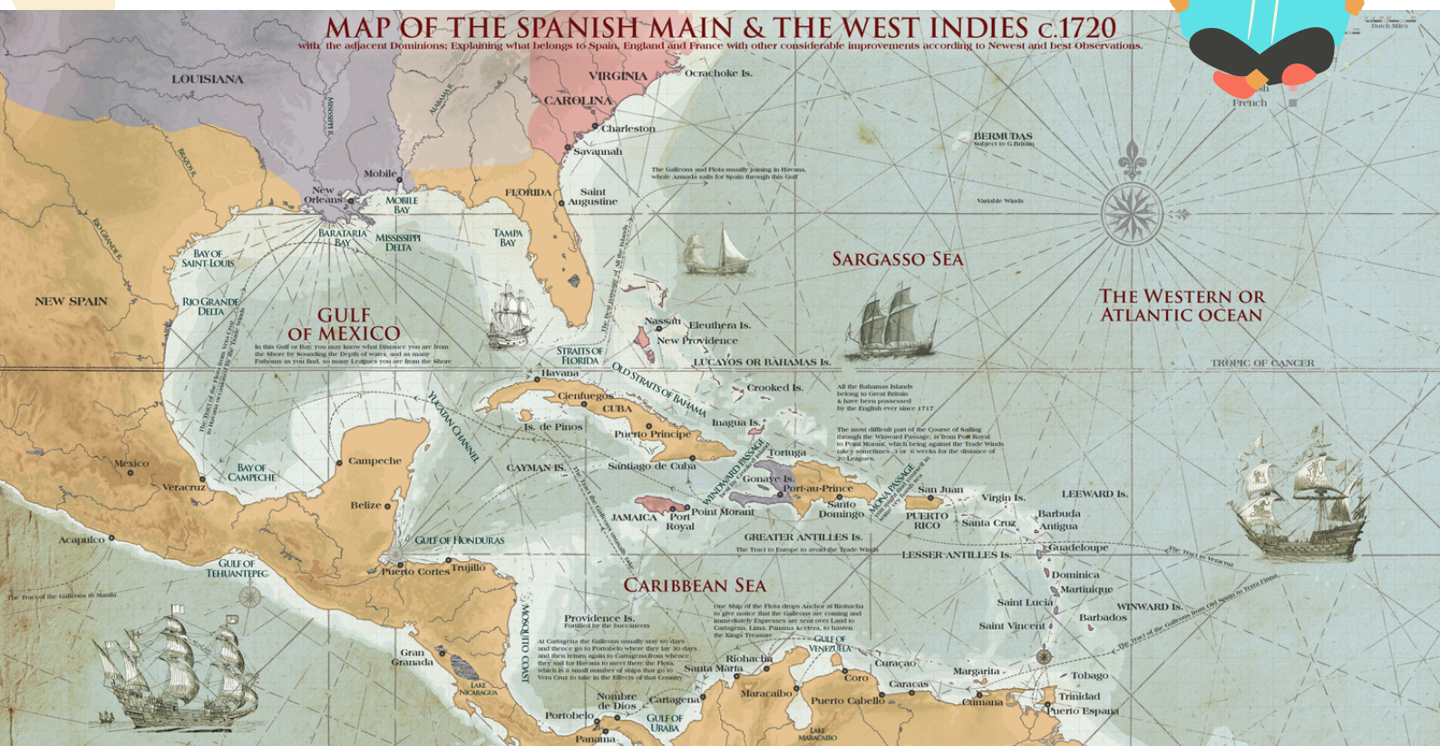
La Tierra Firme del Imperio Español y las Indias Occidentales, c. 1720. World History Encyclopedia. ©Simeon Netchev.

¡En lo profundo del mar hay verdaderos tesoros escondidos! Uno de ellos son los pecios, los restos de barcos que se hundieron hace mucho tiempo. Estos naufragios guardan historias increíbles y objetos valiosos del pasado.