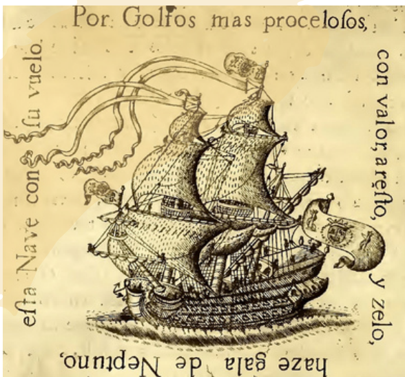
Una impresión en cobre de 1734 de un galeón español.

El Galeón Concepción no era solo un barco, ¡era el orgullo de la flota española! Grande y majestuoso, llevaba una carga increíble: montones de oro, plata, porcelana y joyas. Todos lo admiraban, pero durante un viaje, una terrible tormenta sorprendió a la flota. Las olas gigantes hicieron que muchos barcos se hundieran, incluyendo el Concepción. Sus tesoros se perdieron en el fondo del mar, creando una leyenda sobre este impresionante barco y los secretos que aún guarda bajo las aguas.