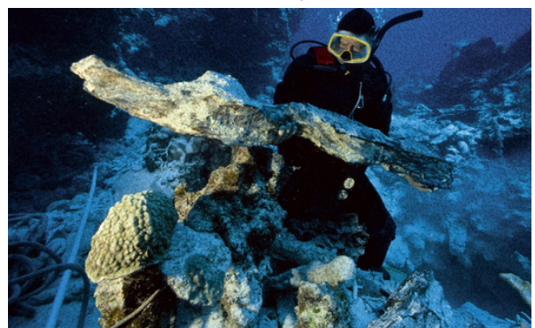
Buzo recogiendo una de las piezas del barco.