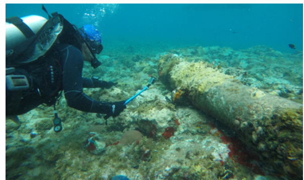
Trabajos de documentación fotográfica de 2017 de uno de los muñones de un cañón de hierro del barco, Región Autónoma de la Costa Caribe Sur de Nicaragua.

El descubrimiento del barco hundido Concepción abrió las puertas a un mundo lleno de misterio y aventuras. Los restos del barco estaban en el fondo del mar, cubiertos por muchos años de historia y rodeados de peces y otros animales marinos que vivían allí. Cada parte del barco cuenta una historia, desde los cañones viejos hasta los restos de las cosas que alguna vez fueron muy importantes para el Imperio español.