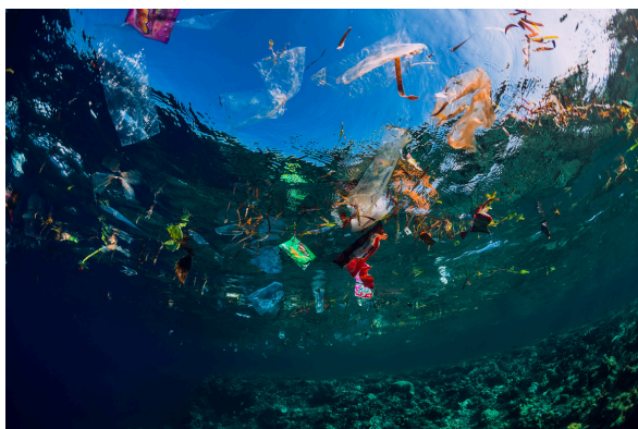
Contaminación por plásticos.

La fideuà es mucho más que un plato típico; representa la historia, la tradición y la identidad de la Comunidad Valenciana. Su origen marinero y su evolución a lo largo del tiempo han permitido que se convierta en un referente culinario. Gracias a su sabor, versatilidad y reconocimiento internacional, la fideuà continúa siendo una de las joyas gastronómicas de la región, uniendo a generaciones en torno a la mesa y promoviendo la cultura mediterránea en el mundo. Su estrecha relación con el mar refuerza su autenticidad y resalta la importancia de la tradición pesquera en la gastronomía valenciana.