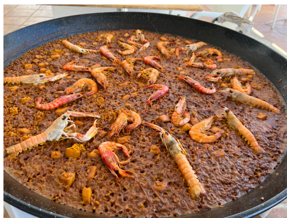
Fideuà valenciana.

Actualmente, existen versiones con fideos gruesos, finos o incluso fideuà negra, elaborada con tinta de calamar.