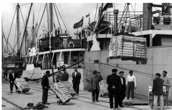
Pescadores en el Grau de Gandía.

La historia de la fideuà se remonta a principios del siglo XX en la localidad de Gandía. A inicios del siglo XX, las embarcaciones de arrastre , conocidas también como "de bou", partían del Grau de Gandía para faenar en el mar . Estas barcas zarpaban alrededor de las cuatro de la madrugada y regresaban al puerto en las primeras horas de la tarde con la pesca del día, la cual se subastaba en la lonja. Este ciclo se repetía a lo largo de todo el año, por lo que, mientras en verano regresaban con la luz del atardecer, en invierno lo hacían aún en plena oscuridad.