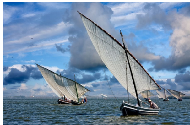
Barcos de vela latina.

Las embarcaciones de vela latina del Mediterráneo son un ejemplo de las naves que estos maestros construían y mantenían.