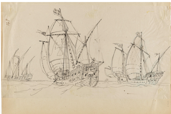
Tres carabelas, 1863-1900. Dibujo sobre papel (24 x 42, 7 cm) Las carabelas eran embarcaciones ligeras a vela. Cristóbal Colón navegó con las conocidas La Pinta, La Niña y La Santa María.

En la Península Ibérica, y el Mediterráneo el trabajo de los carpinteros de ribera fue especialmente relevante durante los siglos XV y XVI, cuando España y Portugal estaban en la cúspide de la exploración y la colonización. En esta época, se construyeron naves como las carabelas y los galeones, que fueron esenciales para los viajes de exploración y el comercio con América, África y Asia.