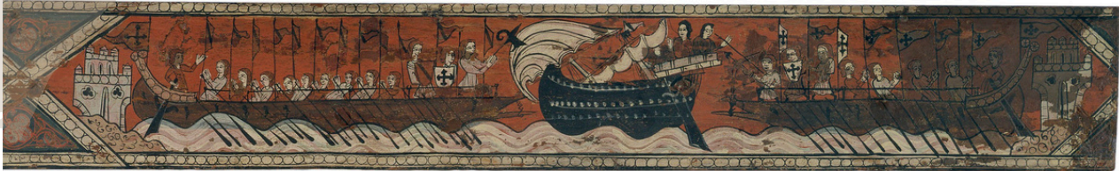
Tabla de artesanado con caballeros, galeras y nave de alta borda, siglo XIV. Temple sobre tabla con acabados de oro (23,5 x 295,2 x 2 cm)

Uno de los ejemplos más emblemáticos es la construcción de galeras y galeones durante el Siglo de Oro español, cuando los astilleros de Sevilla y Cádiz estaban entre los más activos del mundo. Allí, los carpinteros de ribera construyeron los barcos que llevaron a los conquistadores y comerciantes a las Américas y que protegieron las rutas marítimas del imperio español.