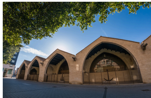
Atarazanas El Grao (Valencia, Comunidad Valenciana).

Las embarcaciones en la zona mediterránea no se construían al aire libre, sino que existían unos recintos denominados atarazanas que se utilizaron a este fin por los carpinteros de ribera. Las atarazanas son unas construcciones de finales del siglo XIV destinadas para la construcción, depósito y reparación de embarcaciones, así como para servir de base militar y que tuvieron un papel muy importante en la prosperidad comercial y marítima en la época medieval. Por último, los calafateadores cerraban bien todas las juntas de las tablas del casco con una mezcla de estopa de cáñamo embebida con brea para evitar que entrara el agua del mar.