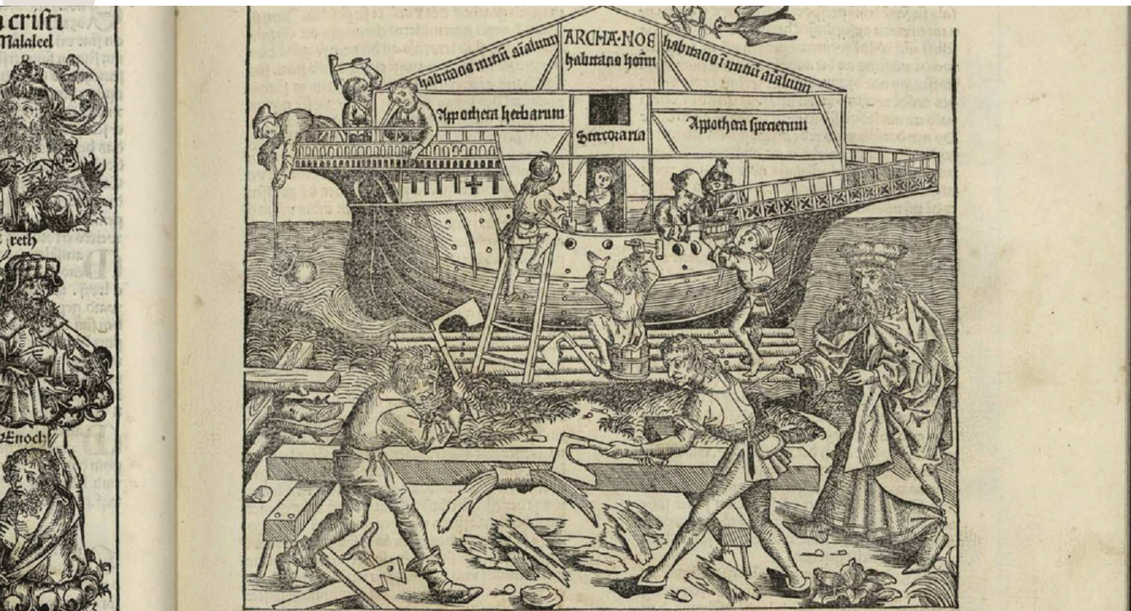
Fragmento del libro Buch der Chroniken und Geschichten (1493), Schedel, Hartmann.

EDUCACIÓN SECUNDARIA - BACHILLERATO - FP