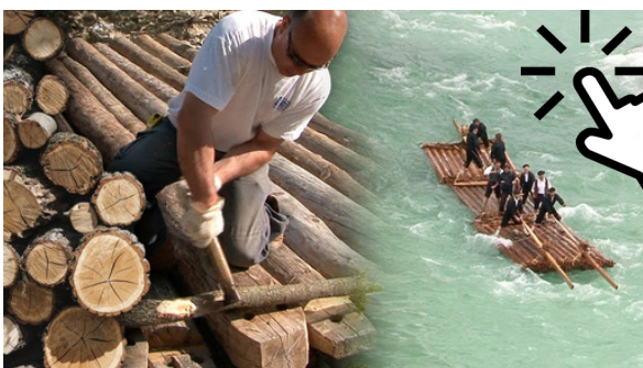
Navatas o transporte de leña por río.