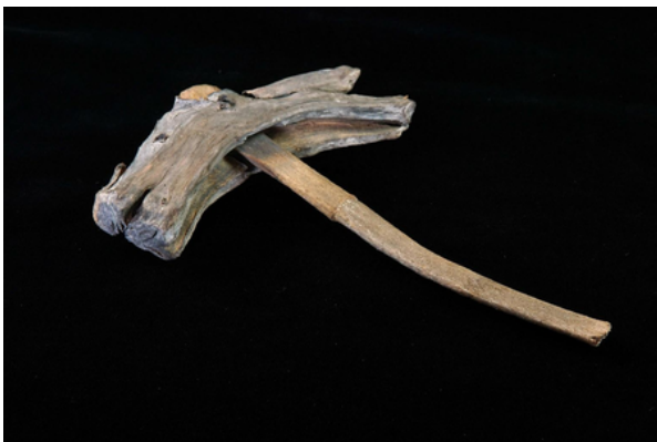
Mazo de madera de carpintero romano para construcción de embarcaciones.

El oficio de carpintero de ribera se remonta a miles de años, cuando las primeras civilizaciones comenzaron a utilizar barcos de madera para el transporte y la pesca . Los fenicios fueron grandes navegantes y por consiguiente unos grandes constructores de barcos con artesanos muy especializados y que dominaron los mares durante muchos cientos de años. Desde los egipcios y romanos, hasta la Edad Media y la Era de los Descubrimientos, los carpinteros de ribera desempeñaron un papel crucial en la expansión del comercio y la navegación marítima.