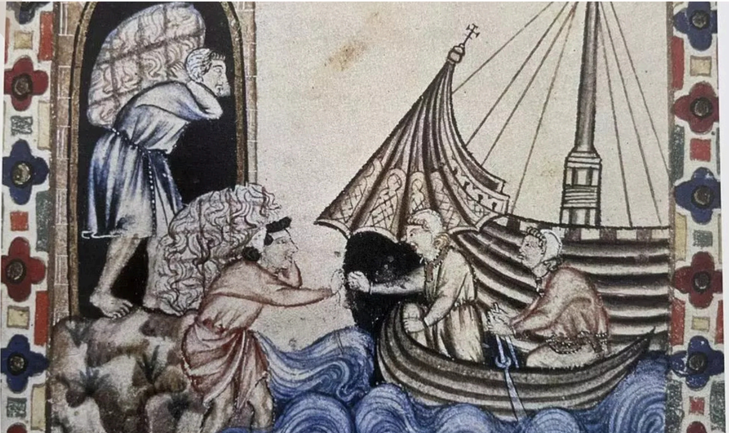
Estiba de lana, Cántigas de Santa María, siglo XIII.

EDUCACIÓN SECUNDARIA - BACHILLERATO - FP