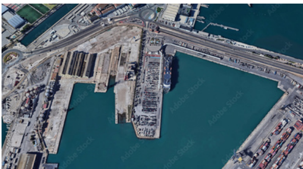
Vista aérea del Puerto de Valencia.

En definitiva, los navegantes no solo enfrentan los peligros del mar y el tráfico marítimo creciente, sino que también tienen la misión de ser guardianes del océano. En el marco de la Agenda 2030, su labor cobra una relevancia aún mayor, convirtiéndolos en actores clave en la construcción de un futuro más sostenible para los mares y océanos del mundo.