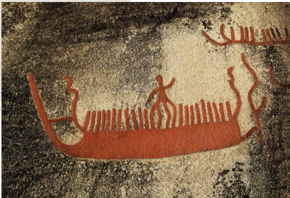
Figuras en un barco, c.1000 a.C.

El oficio de navegante tiene sus raíces en tiempos prehistóricos, cuando los primeros pueblos costeros comenzaron a utilizar troncos y balsas rudimentarias para desplazarse por ríos y mares.