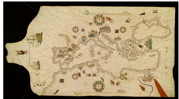
Portulano de Mateo Prunes. 1563. Facsímil del original del Museo Naval.

Además, los cartógrafos desempeñaron un papel esencial en la navegación y el comercio en el Mar Mediterráneo gracias a la creación de cartas portulanas . Estas cartas náuticas, desarrolladas entre los siglos XIII y XV, proporcionaban información detallada sobre costas, puertos y rutas marítimas, permitiendo a los navegantes trazar trayectorias seguras y eficientes. A diferencia de los mapas medievales tradicionales, que solían ser más simbólicos y religiosos, las cartas portulanas estaban basadas en observaciones empíricas y en los conocimientos prácticos de los marinos y navegantes.