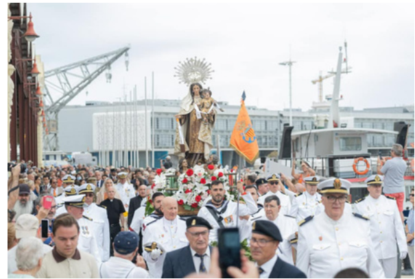
Parroquias y capillas de localidades costeras, pescadores y marineros celebran la festividad de la Virgen del Carmen ©Arzobispado de Valencia.

Las festividades marineras, como la Virgen del Carmen, patrona de los marineros, y las regatas tradicionales, reflejan la conexión de la población con el mar. Además, la construcción naval y la carpintería de ribera han sido oficios fundamentales para la evolución de la navegación en la región. Los astilleros valencianos han desarrollado técnicas especializadas en la construcción de embarcaciones de pesca y transporte, adaptándose a las necesidades comerciales y a la modernización del sector.