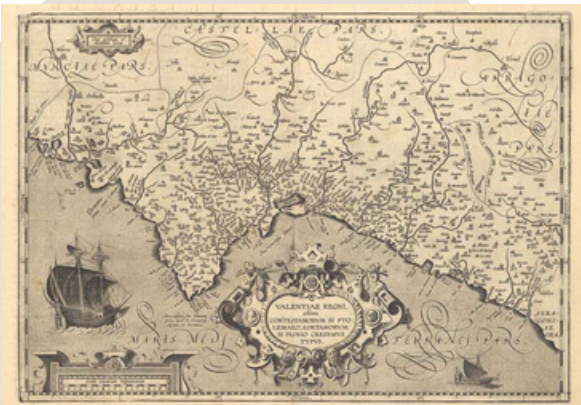
Mapa del Regne de València. Valentiae Regni, olim Contestanorum si Ptolemaeo, Edetanorum si Plinio Credimus Typus.

La ubicación privilegiada de la Comunidad Valenciana en el Mediterráneo ha favorecido una fuerte tradición marinera. Ciudades como Valencia, Alicante y Castellón han sido centros de actividad comercial, conectando la región con el resto de Europa, África y Asia. Durante la Baja Edad Media y la Edad Moderna, los puertos valencianos fueron clave en el comercio de productos como la seda, los cítricos y la cerámica.