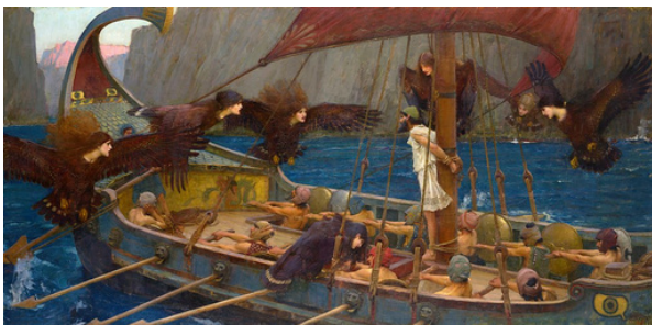
Ulises y las sirenas, 1891. John William Waterhouse. ©National Gallery of Victoria, Melbourne.

Sin embargo, los fenicios fueron pioneros en la navegación comercial en el Mediterráneo, estableciendo rutas marítimas y creando puertos estratégicos. Su dominio del mar les permitió fundar colonias y difundir conocimientos náuticos a otras culturas. Los griegos, por su parte, perfeccionaron la construcción naval y desarrollaron técnicas avanzadas de orientación basadas en la observación astronómica. Además, sus relatos mitológicos , como el viaje de Ulises en la Odisea, reflejan la importancia del navegante en su sociedad.