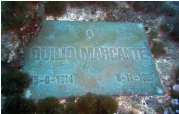
Placa de conmemoración. Imagen de libre acceso.

La idea de poner esta estatua en el fondo del mar fue de Duilio Marcante, quien era amigo de Dario Gonzatti y un experto en buceo. Con la ayuda de buceadores de la Marina Militar Italiana, la estatua fue colocada en el mar en 1954 a unos 18 metros bajo el agua. Después, en 1985, le pusieron un pedestal de piedra, y más tarde, en 2003, la estatua fue restaurada para mantenerla bonita y segura. ¡Incluso una mano que se había separado fue encontrada y puesta de nuevo!