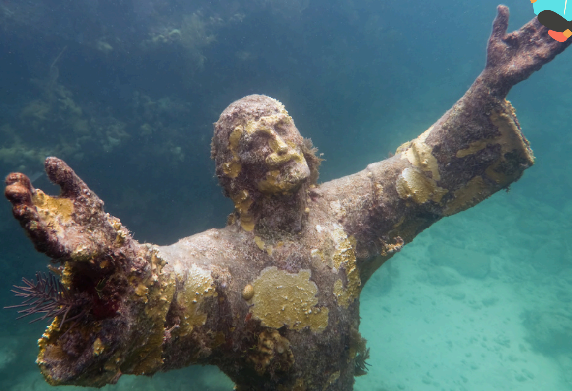
El Cristo del abismo , 1954. Guido Galletti. Bronce (2,5 m).

En las profundidades del Mar de Liguria, en el fondo de la bahía de San Fruttuoso, que está entre dos lugares llamados Camogli y Portofino en Italia , hay una estatua llamada El Cristo del Abismo .