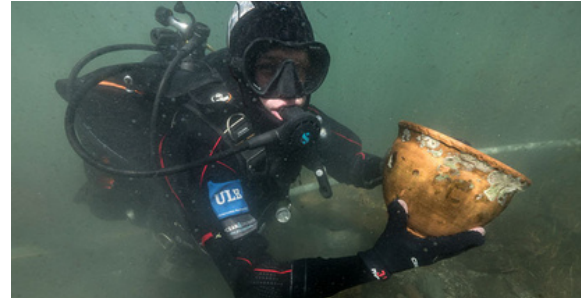
Protección del patrimonio arqueológico subacuático.

Como ciudadanos tenemos un papel crucial en la protección del patrimonio arqueológico subacuático al educarnos, denunciar actividades ilegales, apoyar iniciativas de conservación, participar en acciones de limpieza y promover un turismo responsable.