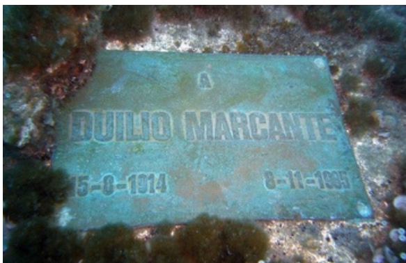
Placa de conmemoración. Imagen de libre acceso.

En 2003 la escultura fue restaurada para preservarla de la corrosión, eliminar así, las incrustaciones y colocar una de las manos del Cristo, que se separó del brazo a causa del impacto con el ancla de una nave y fue rescatada por el buceador Enea Marrone. Tras su restauración, la escultura se volvió a colocar en su ubicación original en 2004, sustituyendo el basamento anterior con uno nuevo y ubicándola a una profundidad ligeramente inferior que antes.