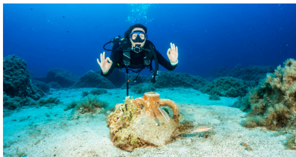
Buceadora con ánfora.

Con pequeños gestos, todos podemos ayudar a proteger los tesoros escondidos bajo el mar.