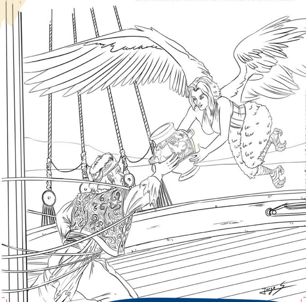
Ilustración realizada por Jorge Sánchez