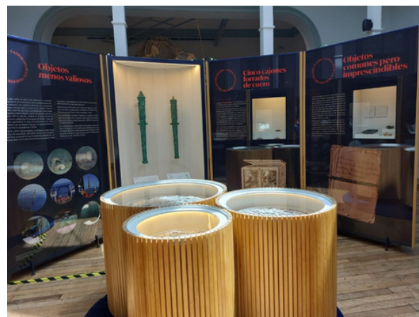
La exposición itinerante Nuestra Señora de las Mercedes. Una historia común en Chile.

Desde su recuperación, el tesoro de la Mercedes ha sido objeto de estudio y conservación. Parte de las monedas y objetos recuperados se exhiben en el ARQVA, permitiendo al público conocer la historia de la fragata y su contexto histórico. Además, se han organizado exposiciones itinerantes, como Nuestra Señora de las Mercedes. Una historia en común , que ha recorrido varios países, incluyendo Chile, donde se inauguró en el Museo de Historia Natural de Valparaíso. Estas muestras buscan resaltar la historia compartida entre España y América Latina y fomentar la cooperación en la protección del patrimonio cultural subacuático.