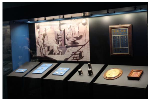
Objetos expuestos en la exposición El Último Viaje de la Fragata Mercedes en el MAN.

Tras la recuperación del tesoro, el Ministerio de Cultura de España, en colaboración con el Instituto Español de Oceanografía y la Armada, organizó varias expediciones científicas al pecio entre 2015 y 2016. Estas misiones, realizadas a más de 1.100 metros de profundidad, permitieron documentar el estado de conservación del yacimiento y recuperar objetos adicionales en riesgo de deterioro, como cañones de bronce, vajillas y otros elementos.