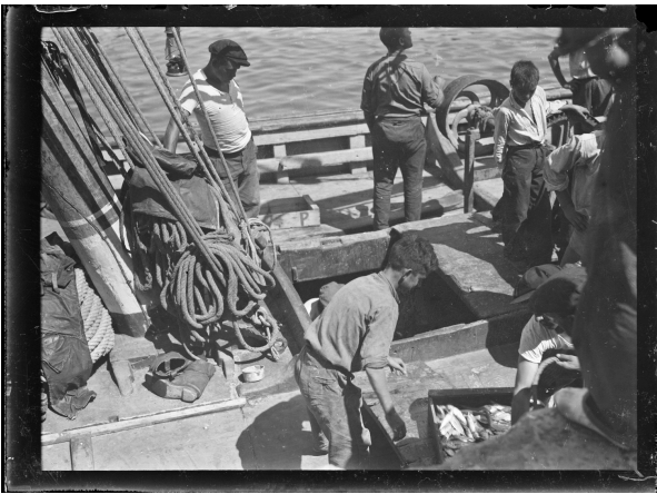
Día de pesca.

Además, la Lonja también funcionaba como el llamado Consulado del Mar , donde trabajaban personas, que ayudaban a resolver problemas entre comerciantes, sobre todo los que venían en barco. Este sitio era muy importante porque ayudaba a que todos los comerciantes del mar Mediterráneo siguieran las mismas reglas. Así, hacer negocios era más seguro y justo para todos.