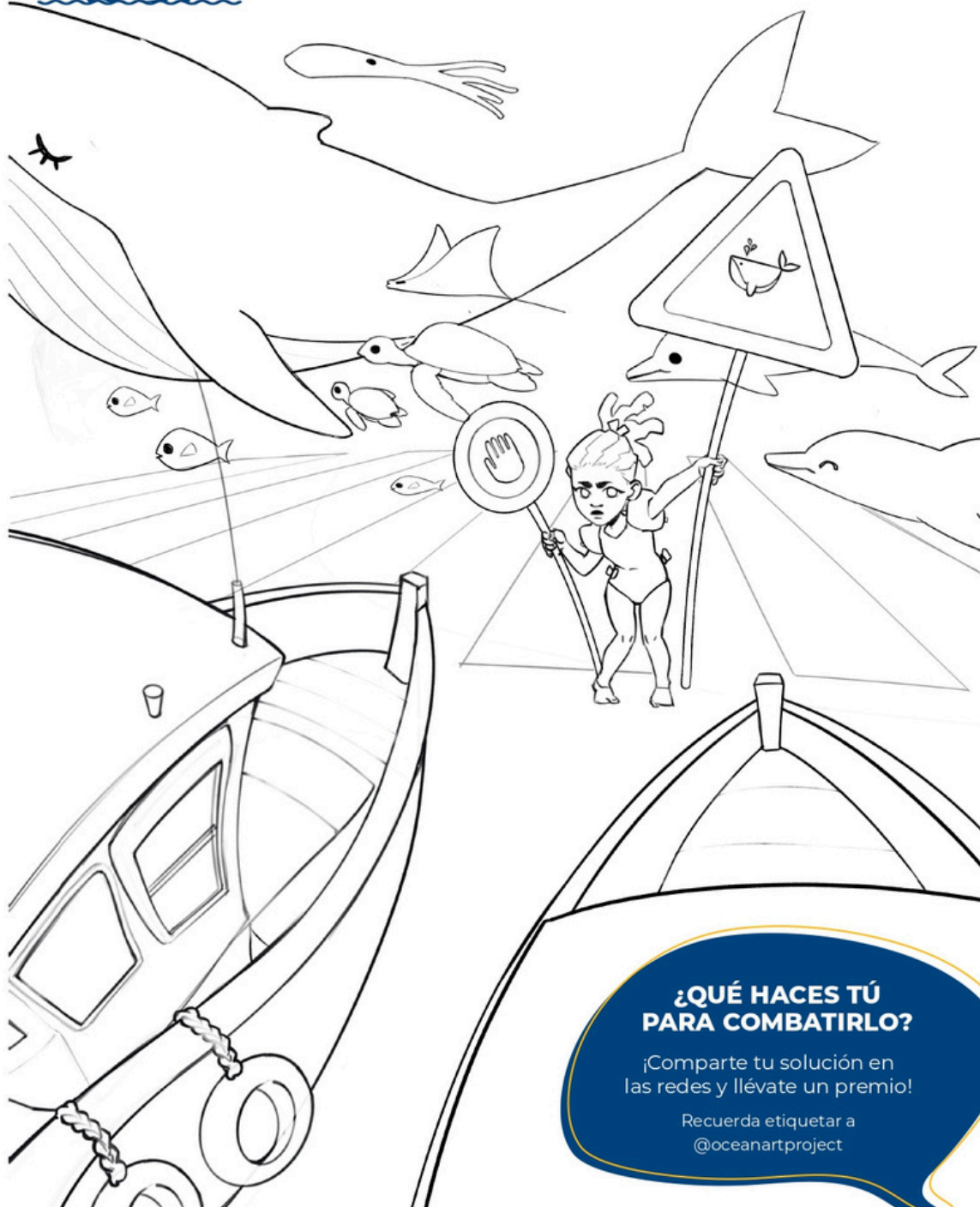
Ilustración realizada por Malú Mosca