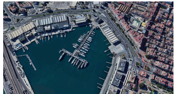
Vista aérea del Puerto de Valencia.

Con estas pequeñas acciones, estamos ayudando a que el mar esté más limpio, haya menos contaminación y se necesiten menos barcos gigantes que ensucian el agua y molestan a los peces.