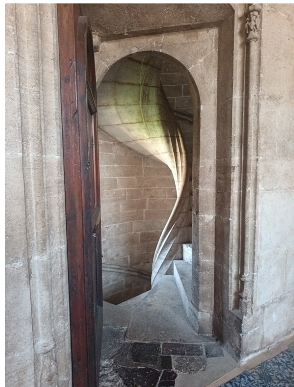
Detalle escaleras.

Los ciudadanos pueden contribuir a reducir el impacto del tráfico marítimo adoptando buenas prácticas como consumir productos de proximidad y pescado local, evitar compras online urgentes, reducir embalajes y reutilizar objetos. También pueden optar por compañías de cruceros sostenibles, usar transporte público o bicicleta, participar en limpiezas de playas y exigir políticas responsables. Estas acciones ayudan a disminuir la necesidad de grandes envíos por mar, reducen emisiones contaminantes y protegen la salud del mar Mediterráneo y de los océanos.