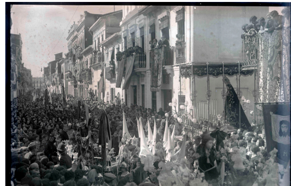
Semana Santa Marinera. [Desfilis/04003-04092]