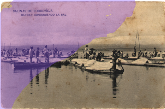
Barcas conduciendo la sal: Salinas de Torrevieja. [JH40/296]

Además, la Lonja albergaba el Consulado del Mar, una institución jurídica que regulaba las disputas entre comerciantes marítimos. Este tribunal garantizaba que las operaciones navales y los contratos relacionados con mercancías – incluido el pescado– se realizasen bajo normas aceptadas por todos los comerciantes mediterráneos, reforzando la seguridad jurídica del comercio marítimo .