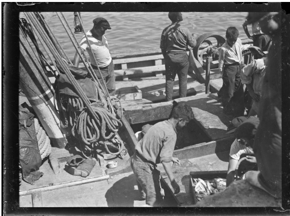
Día de pesca.

Además, la Lonja albergaba el Consulado del Mar, una institución jurídica que regulaba las disputas entre comerciantes marítimos. Este tribunal garantizaba que las operaciones navales y los contratos relacionados con mercancías – incluido el pescado– se realizasen bajo normas aceptadas por todos los comerciantes mediterráneos, reforzando la seguridad jurídica del comercio marítimo .