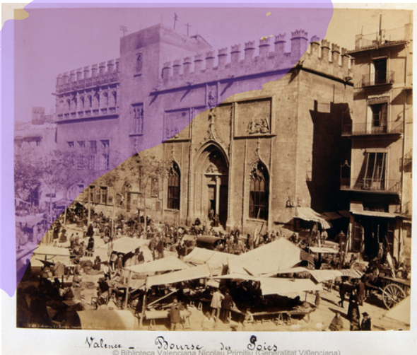
La Lonja : (marché des soies) : Valence. ca. 1888. [F463/004-TG]

La Lonja de Valencia es una de las obras más destacadas del gótico civil europeo, tanto por su monumentalidad como por la sofisticación de su diseño. Construida entre 1482 y 1498 bajo la dirección del maestro Pere Compte, el edificio se organiza en varios cuerpos principales: la Sala de Contratación, con sus imponentes columnas helicoidales que sostienen bóvedas de crucería en un espacio que evoca un palmeral de piedra; la torre central, que albergaba funciones administrativas y punitivas; el Consulado del Mar , añadido en el siglo XVI como sede del tribunal mercantil y decorado con un magnífico artesonado mudéjar; y el Patio de los Naranjos, que articula los espacios mediante un jardín interior.