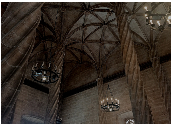
Sala de Contratación de la Lonja de Valencia.

El conjunto se caracteriza por su equilibrio entre funcionalidad y riqueza simbólica, con abundantes elementos decorativos que exaltan la honestidad en el comercio y reflejan el poder económico de la Valencia bajomedieval.