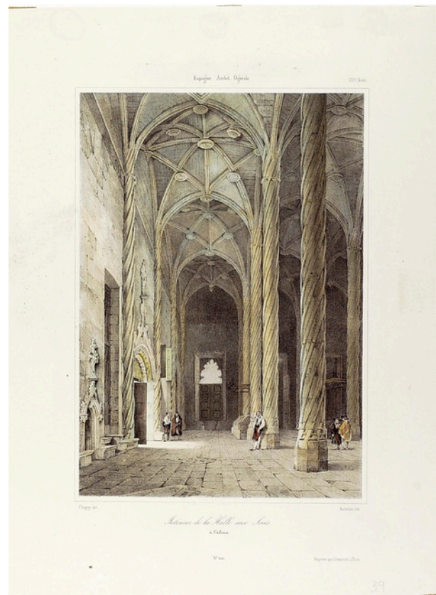
Interieur de la Halle aux Soies à Valence [Grab/26] ©Biblioteca Valenciana Digital.

La Lonja, como edificio monumental, preserva esta memoria material e inmaterial de una ciudad viva y profundamente mediterránea.