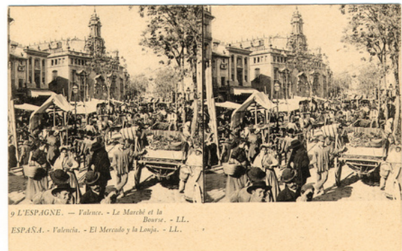
El Mercado y la Lonja : España : Valencia. [JH40/491] ©Biblioteca Valenciana Digital.

La cercanía del Grao de Valencia (el puerto medieval) con el centro urbano facilitó la llegada constante de mercancías que eran negociadas en la Lonja, donde se concentraban no sólo los mercaderes locales, sino también genoveses, florentinos, judíos, mallorquines, catalanes, castellanos, y comerciantes musulmanes del Magreb. Esta condición duraría siglos, convirtiendo a Valencia en un punto estratégico a nivel comercial.