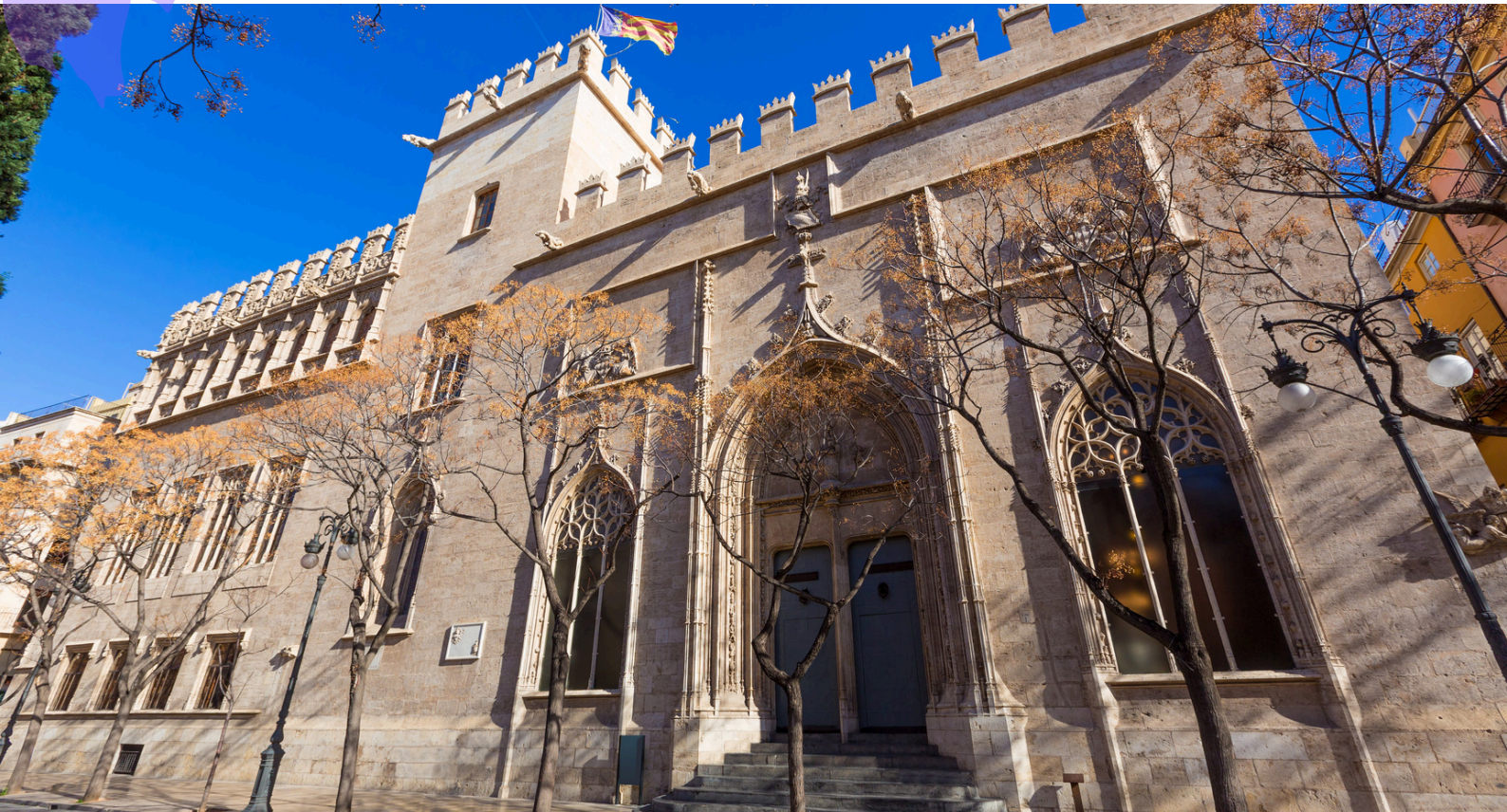
Fachada de La Lonja de Valencia, Comunidad Valenciana.

EDUCACIÓN SECUNDARIA - BACHILLERATO - FP